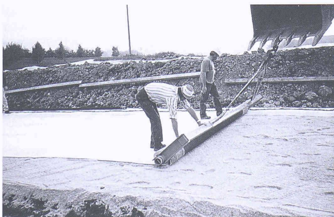
Verlegung der Dichtungsmatte Bentofix® D 4000 direkt auf der Gasdränage aus Glassand

Adolf Locher AG, Stahl, Haustechnik und Baubedarf, Schlieren Brun Elementwerk AG, Betonelemente, Emmen Kalkfabrik Netstal AG, Kalk, Kies, Schotter, Netstal Spleiss AG, Bauunternehmung, Zürich Tektronix AG, Messgeräte, Videosysteme, Drucker, Vernetzung, Zug Zehnder-Runtal AG, Heizkörper, Gränichen