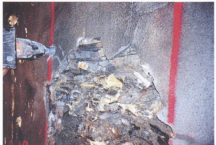
Bild 3. Das alte Tunnelgewölbe wurde in Breiten von 30 bis 50 Zentimetern aufgeschlitzt und ausgebrochen. Das alte Tunnelgewölbe und der gebräuchte Fels dahinter wurden mit Polyurethan verfestigt.