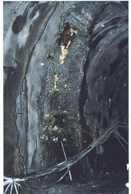
Bild 1. Altes und neues Tunnelgewölbe im Rufenen-Tunnel: Vorne ist die einschalig aufgetragene Spritzbetonschicht zu sehen, in der Bildmitte das ursprüngliche Tunnelgewölbe mit dem Natursteinmauerwerk und der Holzverkleidung. Die hellen Stellen sind Polyurethan-Verfüllungen und Verklebungen

Die Urserenzone, welche der Rufenen-Tunnel in einer Kehre durchquert, besteht von der Geologie her aus mesozoischen Sedimenten und Chlorit-Sericit-Schiefer aus dem Permokarbon, welche zwischen Aar- und Tavetscher-Zwischenmassiv liegen und mit dem Tavetscher Zwischenmassiv stark verfaltet und verschuppt sind. Sie sind in die engen, steilstehenden Strukturen, die bei der Bildung der Alpen entstanden sind, eingefaltet. In der Urserenzone finden sich viele junge, zum Teil heute noch aktive Bruchsysteme. Die Konstellation hat, wie an vielen anderen Orten in den Alpen, zur Folge, dass im Bereich des Rufenen-Tunnels Sedimentgesteine und Schiefer sich abwechseln und in einem unterschiedlichen Zustand befinden. Dort, wo aktive Bruchsysteme arbeiten, ist das Gestein stark zermalmt und aufgelockert. In diesen sogenannten mylonitisierten Zonen muss die Standfestigkeit des Gebirges, zum Beispiel durch Injektion von Polyurethan, verbessert werden.