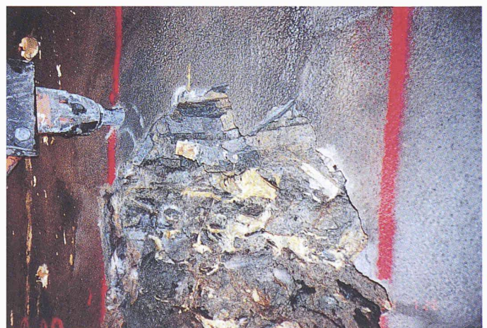
Bild 3. Das alte Tunnelgewölbe wurde in Breiten von 30 bis 50 Zentimetern aufgeschlitzt und ausgebrochen. Das alte Tunnelgewölbe und der gebräuchte Fels dahinter wurden mit Polyurethan verfestigt.