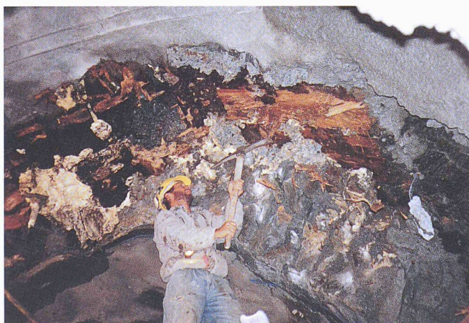
Bild 2. Altes und neues Tunnelgewölbe im Rufenen-Tunnel: Gut sichtbar sind die Hinterfüllungen