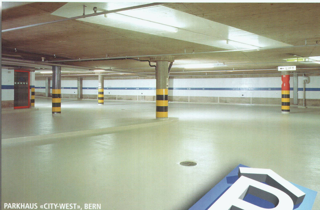
PARKHAUS «CITY-WEST», BERN