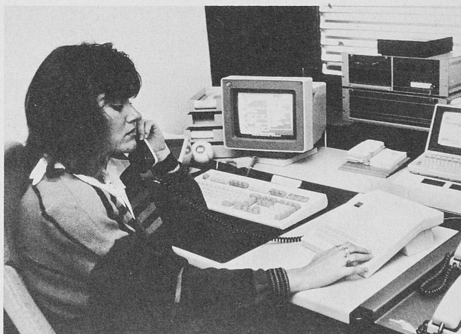
Blick in die «Servitel»-Einsatzzentrale von Schindler in Ebikon

Kongressanmeldung: Messe Basel, Kongressdienst, Messeplatz 22, Postfach, 4021 Basel, Tel. 061/686 28 28, Fax 061/686 21 85.