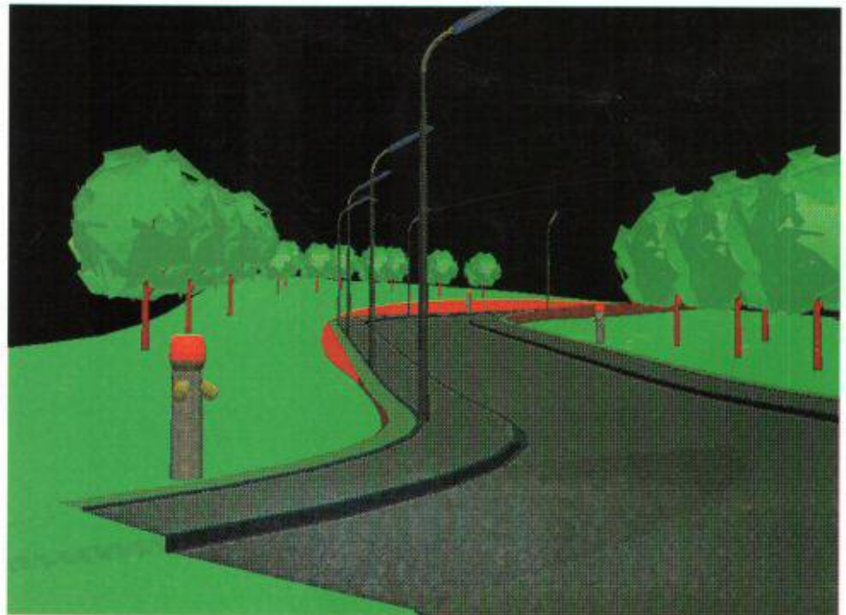
Visualisierung einer Quartierstrasse mit InRoads .

Sind Sie an einer umfassenden Lösung Ihrer Planungsprobleme interessiert, rufen Sie uns an und vereinbaren einen Gesprächstermin.