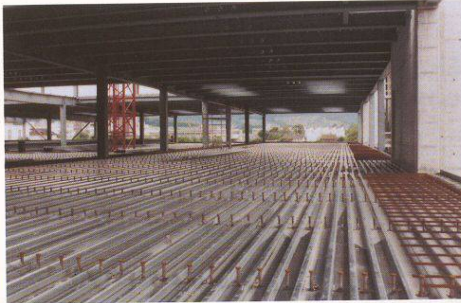
Bild 4. Zwischengeschossboden einer Haupthalle vor dem Betonieren

noch wirklichkeitsnahen Modellen zu erfassen. Die Modellbildung ist eine der schönsten und kreativsten Ingenieuraufgaben und beeinflusst das spätere Aussehen, die Funktionstüchtigkeit und die Kosten der Tragkonstruktion massgebend.