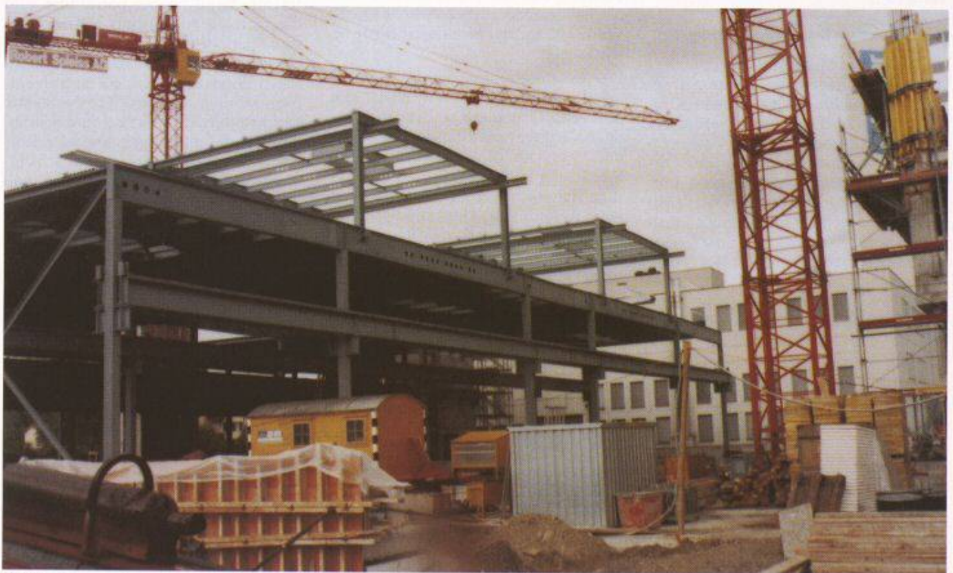
Bild 1. Quer auf den Haupthallen werden zwei 55 m lange Kleinprüfhallen montiert

Bis zum Sommer 1989 wird geprüft, ob die im Vorprojekt gewählte Stahlkonstruktion den Anforderungen wirklich standhält, ob sie die Maschinen auf dem Dach und die belasteten Krane tragen und die Erdbebenkräfte ohne Wände ableiten kann. Es geht darum, das komplexe Gebäude in einfachen und den-