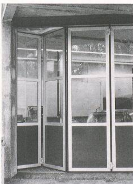
Alu-Falttorfront einer Servicegarage: Unterhaltsarme Bauweise, rasches Öffnen, gute Wärmedämmung, lange Lebensdauer

Natürlich weist jede Torart ganz spezifische Vor- und Nachteile auf (siehe Ver-