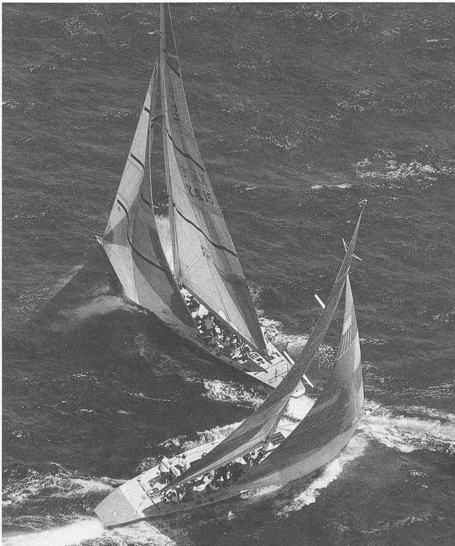
Bild 8. Es muss in der Aus- und Weiterbildung zu Kursänderungen kommen

zu und wandelt sich gleichzeitig in dynamischer Richtung. Hierin schlägt sich das gewachsene Bewusstsein nieder, dass die heutigen Herausforderungen (Komplexität usw.) auch zeitgemässe Antworten erfordern. «Während in früheren Jahren unter Projektmanagement vor allem Kosten- und Terminplanung/-überwachung verstanden wurden, gehen die heutigen Interpretationen weiter und mehr in Richtung einer ganzheitlichen Betrachtungsweise, wobei das Systemengineering im Mittelpunkt steht» [20].