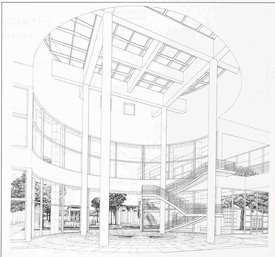
Bild 5. In der Dynamischen Planung ist Kreativität gefragt (P. Getty Center von R. Meyer)

Die professionelle Teamarbeit erscheint als eine der wichtigen Vorbe-