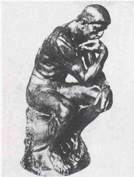
Bild 1. Die Denkkapazität des Menschen ist leider sehr beschränkt

Wie wir heute wissen, waren die Erwartungen nicht nur zu hoch angesetzt, sondern vor allem durch eine unangemessene Einstellung und Denkweise geprägt. Man orientierte sich stark an einem mechanistischen Bild der Planung . Man sah die Entwicklungen kausal determiniert [1]. Es bestand z.B. die Meinung, dass die Umsatzprognose