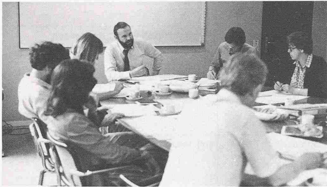
Bild 4. Die professionell geführte Teamarbeit gehört zu den wichtigsten Mitteln der Dynamischen Planung

lung ergibt sich aus der Erkenntnis, dass