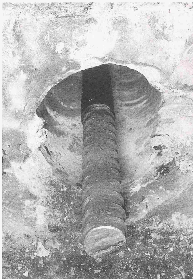
Bild 2. 17jähriger Ankerstab präsentiert sich nach Demontage des Ankerkopfes wie im Neuzustand