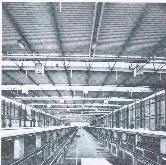
Bild 2. Innenansicht der grossen Halle