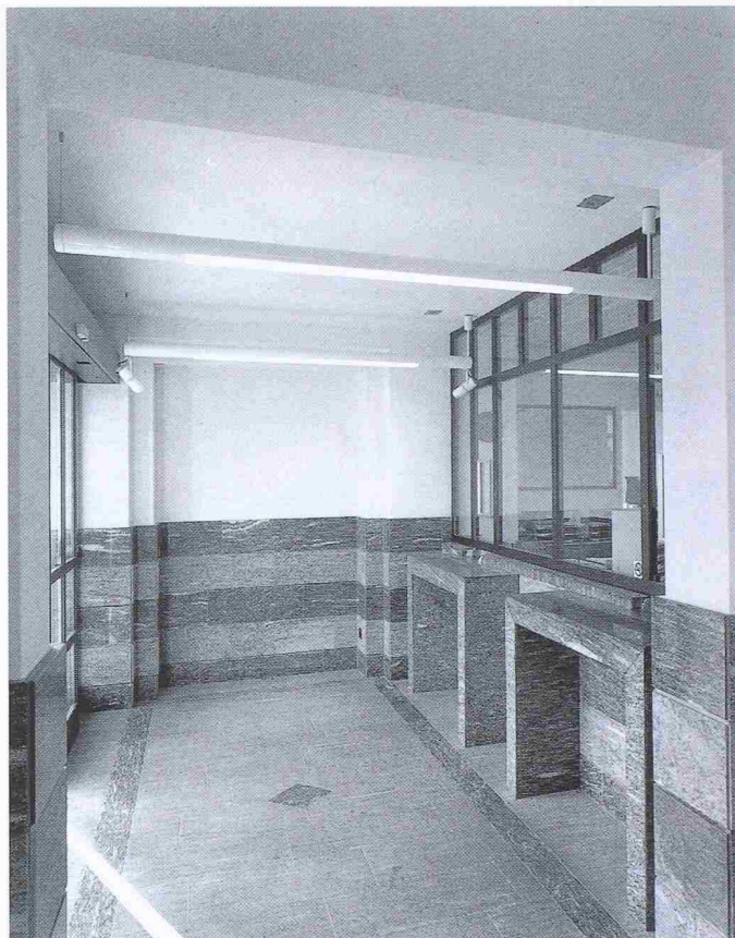
Bild 3. Detail Schalterhalle