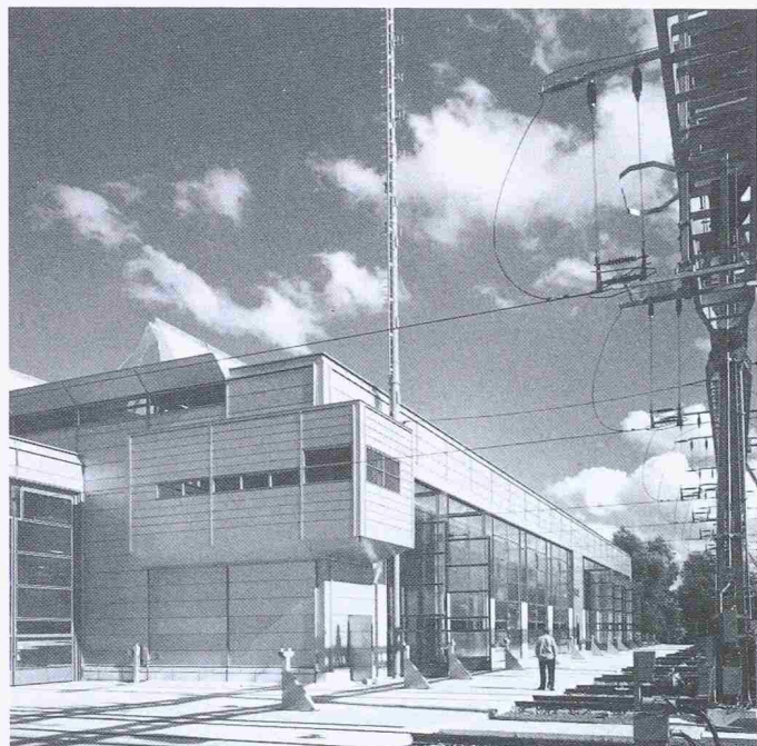
Bild 1. Torfassade mit Kommandoraum