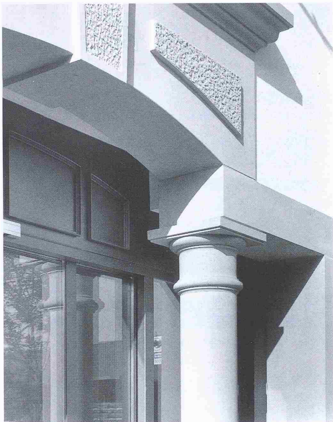
Bild 2. Detail Eingang