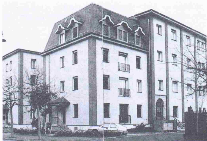
Gute Wohnadresse in Winterthur: Die ehemalige Textilfabrik nach dem Umbau in ein Appartementhaus

Beispiele dafür gibt es auch bei uns in der Schweiz. So findet man in Winterthur 32 komfortable Wohnungen in den ehemaligen Fertigungsgebäuden der Textilfabrik Naegeli. Dabei unterscheiden sich die hier eingerichteten Wohnungen in keiner Weise vom übrigen Wohnungsangebot am Ort - es sei