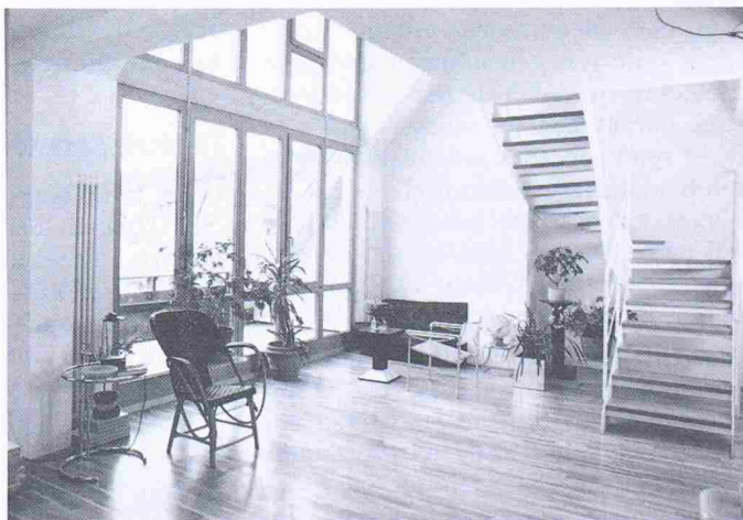
Die Maisonette-Wohnung im Dachgeschoss einer alten Stuttgarter Nudelfabrik