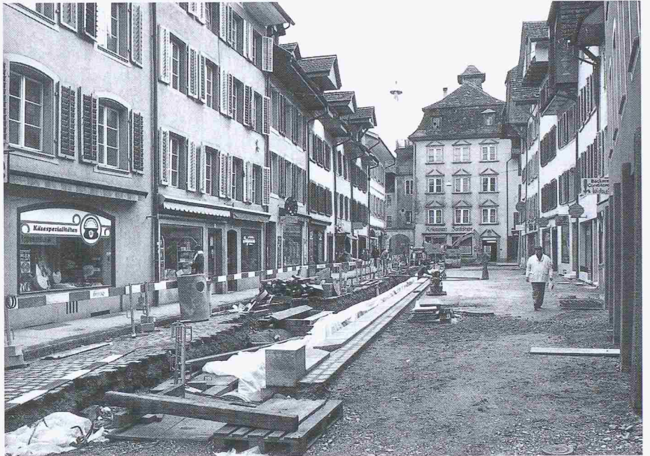
In der zur Fussgängerzone umgestalteten Pelzgasse soll auch Aaraus Stadtbach wieder plätschern dürfen

Auf dem neugestalteten Bahnhofplatz, mit der wunderschönen Lage am See, soll auch in Zukunft ein Stück an die Vergangenheit aus glorreichen Eisenbahntagen der Jahrhundertwende erinnern: Das ehemalige Bahnhofs-Hauptportal wird – mitsamt der krönenden Skulpturen-Gruppe «Zeitgeist» – wiederaufgebaut, sozusagen als strahlender Solitär auf dem ansonsten verkehrsdurchfurchten Décolleté einer vielbereisten Stadt.