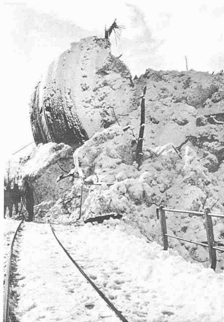
Bild 2. Die historische Photographie von der Minacheri-Lawine von 1942 gibt einen anschaulichen Eindruck von der Gewalt solcher mit Bäumen und Felsbrocken durchsetzter Nassschneelawinen