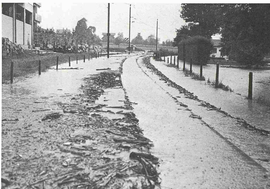
Bild 3. Das überschwemmte Trasse der Brünigbahn nach dem schweren Unwetter von 1984 in Sachseln

Narben in der Baumrinde sprechen eine deutliche Sprache. Herumliegende Felstrümmer deuten darauf hin, dass der Felsrutsch vom 8. September 1986 oberhalb Giswil sich mit einer in geologischen Zeiträumen wiederholenden Periodizität ereignet. Neben den Steinschlägen sind aber auch Zonen mit deutlich messbarem Kriechverhalten, wie etwa das Hüttstettmassiv bei Lungern, bekannte Problemgebiete.