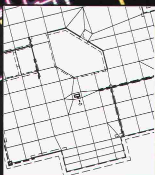
Ausschnitt aus Elementmaschen