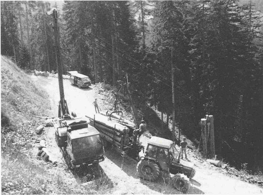
Bild 3. Der Mobilseilkran K-600 Sanasilva beim Bergauftransport von Trümmern aus einer Zwangsnutzung im Gebirgswald