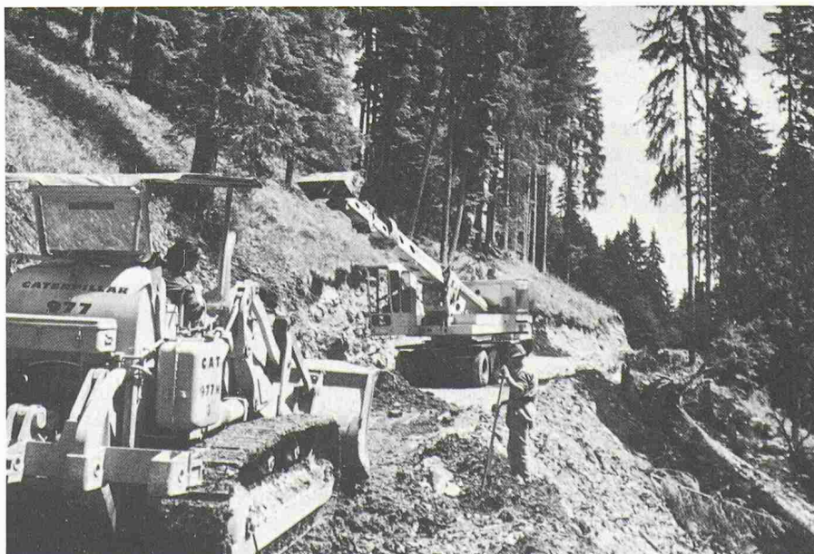
Bild 1. Im Berggebiet ist der Bau von Waldstrassen oft mit grossen Schwierigkeiten verbunden und bedeutet immer einen grossen Eingriff in die Natur (Foto im Simmental: FZ).

Die Tatsache, dass Forstdienste und Forstbetriebe lastwagenbefahrbar Strassen fordern, kann nur anhand des bestehenden Zusammenhangs zwischen Waldpflege und Holznutzung erklärt werden, denn diese Strassen werden hauptsächlich durch den Abtransport des geschlagenen Holzes bedingt.