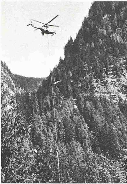
Bild 2. Ein Helikoptereinsatz zum Holzabtransport ist mit hohem Aufwand verbunden, der in keinem Verhältnis zum erzielbaren Holzerlös steht

Schon im Rahmen der Jungwaldpflege, spätestens ab der Stangenholzstufe, wo die ersten Auslesedurchforstungen vollzogen werden, fällt Holz an, das genutzt werden kann. Die Mengen nutzbaren Holzes nehmen bei den späteren Durchforstungen wie Lichtdurchforstungen ständig zu. Schliesslich ist die Nutzung des Altholzes eine Voraussetzung, die Verjüngungsphase, wenn immer in Form von Naturverjüngung, einzuleiten. Ein weiterer Grund spricht für den Abtransport des gefällten oder gefallenen Holzes: Je nach der Jahreszeit muss das von Borkenkäfern befallene Holz aus dem Wald geschafft werden, um eine weitere Vermehrung dieses Schädling zu verhindern. So gibt es Beispiele im Urnerwald (Wängiswald auf der rechten Seite des Urnerbodens, Gemeinde Spirigen), wo die infolge des Föhnsturms vom April 1987 anfallenden Zwangsnutzungen per Helikopter aus dem Wald herausgeholt werden mussten, weil der Wald zu wenig erschlossen war. Der Helikoptereinsatz aber ist mit einem zu hohen Aufwand verbunden, der in keinem Verhältnis zu den erzielbaren Holzerlösen steht (Bild 2).