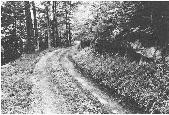
Bild 5. Waldstrassen können an geeigneten Stellen gut ins Landschaftsbild eingefügt und rücksichtsvoll geplant werden