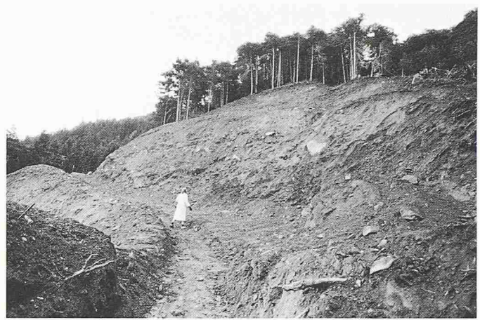
Bild 6. Die Kritik am Waldstrassenbau verstärkt sich, wenn dieser sichtbare Wunden in der Landschaft hinterlässt und dem Wald mehr schadet als nützt