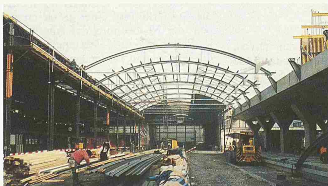
Bild 3. Schutz- und Arbeitsbühne über den Gleisen