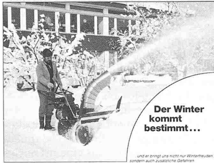
Der Winter kommt bestimmt...

und er bringt uns nicht nur Winterfreuden, sondern auch zusätzliche Gefahren