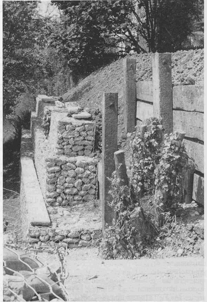
Steinkörbe, Bahnschwellen, bestehende noch begrünte Gehölz-Strünke, Fallholz als Geländeverbauung mit Treppe

damente oder Kieslager voraus. Nun gibt es Situationen, wo Betonfundamente unerwünscht oder unmöglich sind, Kiesschüttungen auf die Dauer aber nicht genügen. Ein derartiger Fall hat uns auf die Idee gebracht, Kiesschüttungen während und nach der Steinsetzung mit einer Zementschläme zu tränken und damit nach deren Abbinden zu stabilisieren. Schon dieser elementare primitive Akt gibt in geeigneten Situationen die Möglichkeit, Bodenbefestigungen in natürlichen Schüttungen vorzunehmen, ohne durch aufwendige Abschaltungen und Etappenarbeit das Werk aus Kostengründen zu verunmöglichen.