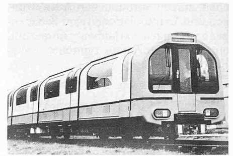
Prototypzug für die Central Line der Londoner U-Bahn. Brown Boveri hat diesen von Metro Cammell gebauten Zug mit modernsten GTO-Chopper-Antrieben ausgerüstet

- Allachsantrieb, wobei jede Achse durch einen fremderregten Fahrmotor Typ 4 EBO 1622, Baureihe «K», angetrieben wird. Der Motor mit einer BBC-Gummikupplung zwischen Motor und Getriebe (BBC-Leichtgetriebe Typ BGA 08.01) wird fest abgedeckt im Drehgestellrahmen eingebaut.