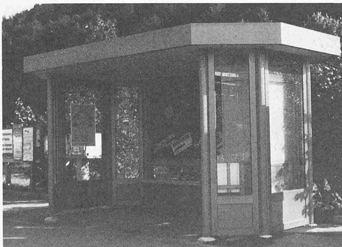
Buswartehalle im ABR-Tragsystem