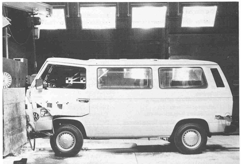
Der VW-Transporter nach einem Aufprall mit etwa 50 km/h gegen eine starre Wand. Der Innenraum wurde kaum deformiert. Die Türen blieben geschlossen, konnten aber nach dem Versuch ohne Schwierigkeiten von Hand geöffnet werden. Die Verlagerung der Lenkung war gering, und die Kraftstoffanlage blieb dicht.

Die passive Sicherheit ist durch gezielte konstruktive Massnahmen gewährleistet. Die verformungssteife Rahmenkonstruktion der Bodengruppe erhöht die Widerstandsfähigkeit bei Frontalkollisionen. Die Aufprallenergie wird über Stossfänger weitgehend aufgefangen und von Deformationselementen abgebaut. Über dem Fahrzeugrahmen wirken in vertikaler sowie längs und quer in horizontaler Richtung und in verschiedenen Ebenen verlaufende Profile wie ein Gerüst, das Fahrer und Mitfahrer umgibt und übermässige Fahrerhausdeformationen mindern hilft.