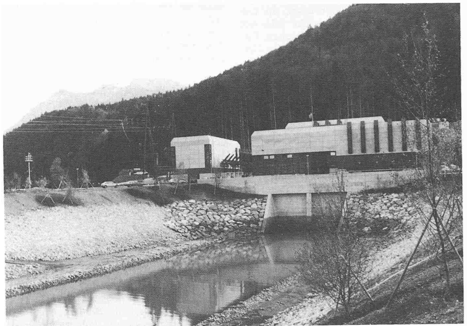
Krafthaus bei Beschling

Ebenso wichtig sind die während der letzten zehn bis 15 Jahre von Wetter-Satelliten aus erfolgten Beobachtungen. Deren Messdaten und Bilder der Erdoberfläche sind meist archiviert. Gewässerverhältnisse lassen sich damit über Jahre zurückverfolgen.