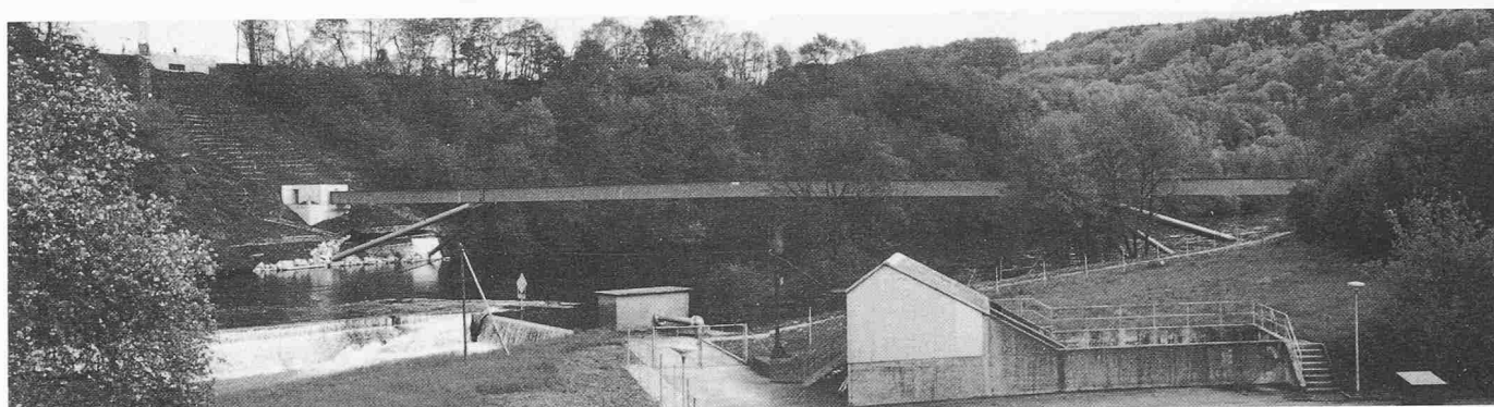
Bild 10. Fertig montierte Brücke. Schlussanstrich und Begrünung der Uferböschung fehlen noch

im Zusammenhang mit der Platzreserve für die Fernwärmeleitungen, welche ebenfalls zu Lasten der Gemeinde Obersiggenthal gehen. Diese Kosten sind im Verhältnis zu den Gesamtkosten jedoch sehr klein.