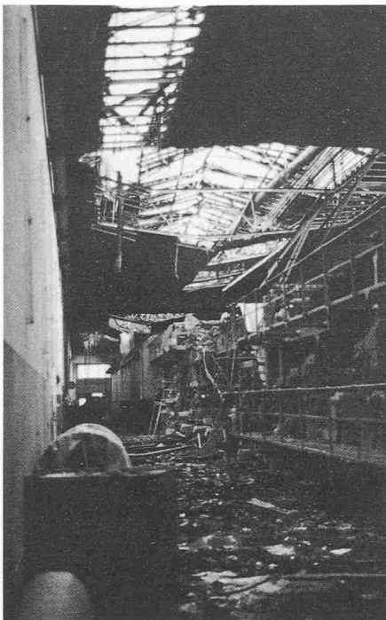
Bild 1. 15. Dezember 1982. Blick in die durch einen Grossbrand zerstörte Maschinenhalle. Herabstürzende Deckenteile haben die Kartonmaschine stark beschädigt. Durch Hitze und Feuer sind Tragkonstruktion und Dach vollständig zerstört worden