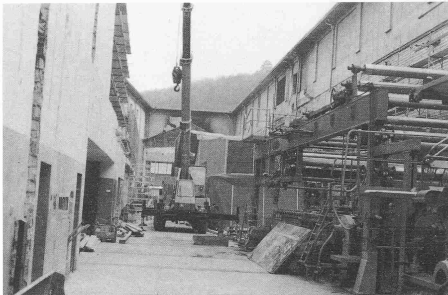
Bild 2. Mitte Februar 1983. Abschluss der Aufräumarbeiten vor Beginn der Stahlbaumontage

Bevor jedoch mit dem Neubau begonnen werden konnte, mussten erst die Reste des Daches und die ganzen Seitenwände abgerissen werden, wobei darauf zu achten war, dass die Kartonmaschine keinen Schaden nahm. Der Wiederaufbau wurde so durchgeführt, dass zur gleichen Zeit an der Maschine die notwendigen Reparatur- und Instandstellungsarbeiten ausgeführt werden konnten sowie Testläufe möglich waren. Um die Kartonmaschine und die bereits mit Reinigungs- und Repara-