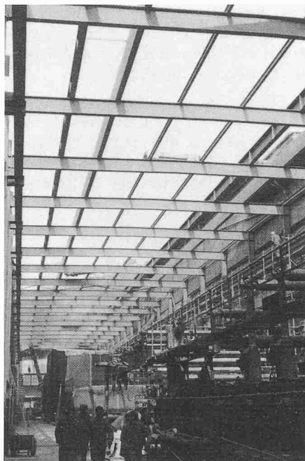
Bild 3. Ende Februar 1983. Stahlbaukonstruktion fertig montiert, bereit für die Dacheindeckung und die Montage der Oblichter