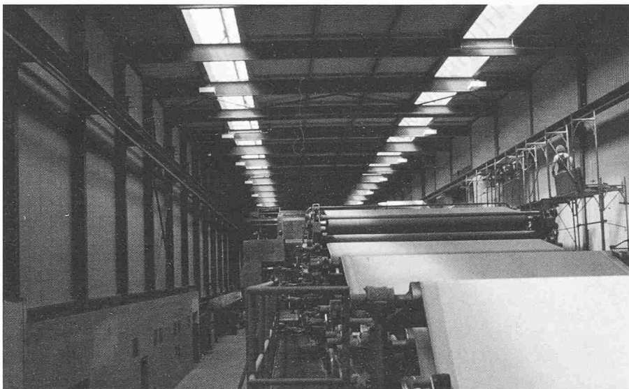
Bild 5. Kartonmaschine wieder in Betrieb