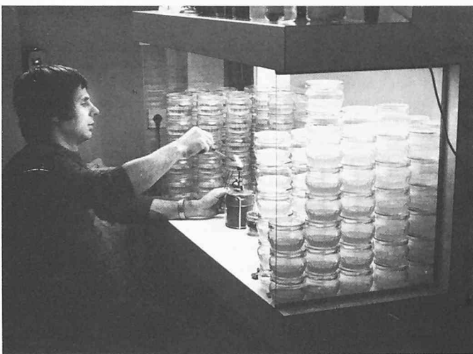
In einer «Impfkammer» werden kleine Pflanzen oder Sprosssteile, die in Gläsern auf Nährmedien gezüchtet werden, mit Agrobakterien infiziert. Anders als im Gewächshaus wird hier unter sterilen, kontrollierten Bedingungen gearbeitet und ein Befall der Versuchspflanzen durch andere Mikroorganismen verhindert

Das zweite Ziel ergibt sich aus der Tatsache, dass Pflanzen ihre Speicherproteine zunächst für ihren eigenen Gebrauch bilden, und das deshalb die Zusammensetzung dieser Proteine nicht immer ideal für die menschliche Ernährung ist. So enthalten beispielsweise Mais-Proteine zu wenig Lysin und Methionin, beides sogenannte essentielle Aminosäuren, die der Mensch nicht selbst synthetisieren kann und deshalb mit der Nahrung aufnehmen muss: Ist er, wie etwa in südamerikanischen Ländern, auf Mais als Hauptnahrungsmittel angewiesen, dann drohen ihm Mangelkrankheiten.