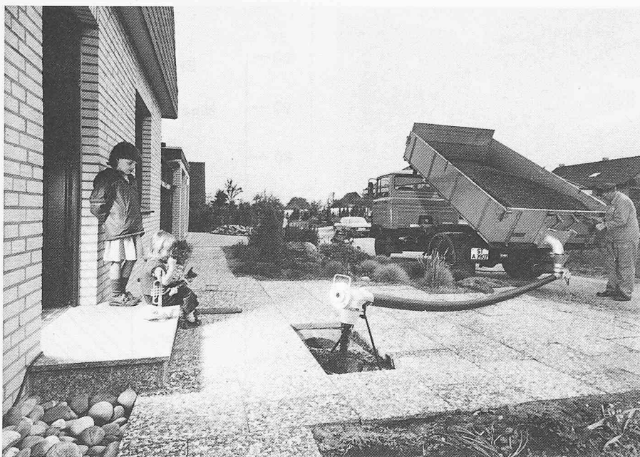
Bild 7. Zeitgerechte Brennstoffanlieferung

Für die Förderung des Brennstoffes haben sich der Spiralförderer und der Rohrkettenförderer bewährt (Bild 6).