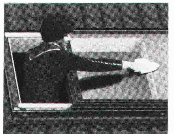
Beim Braas-Atelierfenster problemloses Reinigen auch der Fenster-Aussenseite.