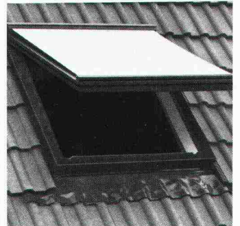
Reichhaltiges Zubehör: Rollos, Jalousetten oder Markisen.

Die eloxierten Aluminiumteile und der durchgefärbte Hart-PVC sind absolut witterungsbeständig und rostfrei. Zur Auswahl stehen 8 verschiedene Fenstergrößen und Verglasung nach Wunsch: Sonnenschutz-, Sicherheits-, Isolier- oder Thermopluglas.