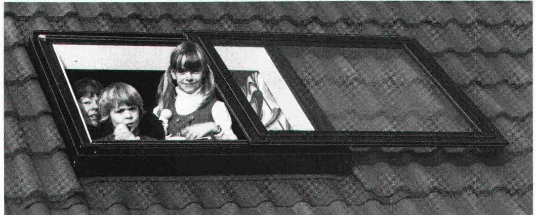
Das Braas-Atelierfenster lässt den Sonnenschein herein.

Zum behaglichen Wohnen in einem Dachraum gehört das Tageslicht, der freie Ausblick zum Himmel und in die Natur. Aber versuchen Sie einmal, die Sonne so richtig hereinzulassen, wenn sich das Dachfenster nur bis zu einer bestimmten Öffnung hochkippen lässt. Oder wenn schon, wie klappen Sie ein ganz aufs Dach hochgelegtes Fenster wieder mühelos zurück?