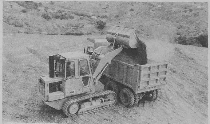
Der neue Caterpillar-Kettenlader 943. 11,2 t Einsatzgewicht, 60 kW (80 PS) Motorleistung, Kübelinhalt 1150 l.

Radlader. Von den 8 Caterpillar-Radladern stellen wir aus: Caterpillar 910: 6,8 t Einsatzgewicht; 48 kW (65 PS) Motorleistung; 1000-l-Kübel; «Mädchen für alles»! Kompaktnadler; trotzdem alle Vorteile der grösseren Modelle: Planetenantrieb; Wandler; 5-l-Motor mit Direkt-einspritzung und viel Kraftreserve. Caterpillar 950: 13,7 t Einsatzgewicht; 97 kW (130 PS) Motorleistung; 2300-l-Kübel; jetzt mit neuem Fahrerstand: ROPS-Sicherheitskabine mit optimalem Komfort, lückenlose Überwachungsmöglichkeit aller wichtigen Maschinenfunktionen. Caterpillar 980-C: 26,9 t Einsatzgewicht; 201 kW (270 PS) Motorleistung; der 4 m 3 Radlader mit der erstaunlich hohen Ausbrechkraft von 26 700 kg. Das ideale Gerät für den Hochleistungsbetrieb (z. B. in Kies- und Steingruben). Geringer Wartungsaufwand (z. B. Schmierung des untern Kübelbolzens nur alle 2000 Stunden).