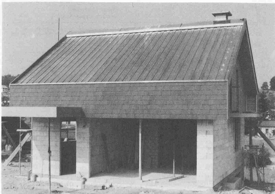
Bild 1. Energiedach Sessa-Therm

Das Energiedach Sessa-Therm ist ein Metaldach, mit dem der Umwelt – aus Sonne, Regen und Nebel – Wärme entzogen wird. Die Wärme wird mittels einer Wärmepumpe auf ein höheres Temperaturniveau gebracht, so dass sie für die Raumheizung und die Erwärmung des Brauchwassers verwendet werden kann. Das Energiedach Sessa-Therm ist aber nicht nur ein Wärmetauscher zur Aufnahme der Umweltwärme, sondern auch ein wasserdichtes, isoliertes Dach. Es ersetzt somit die herkömmliche Dacheindeckung inkl. Isolation.