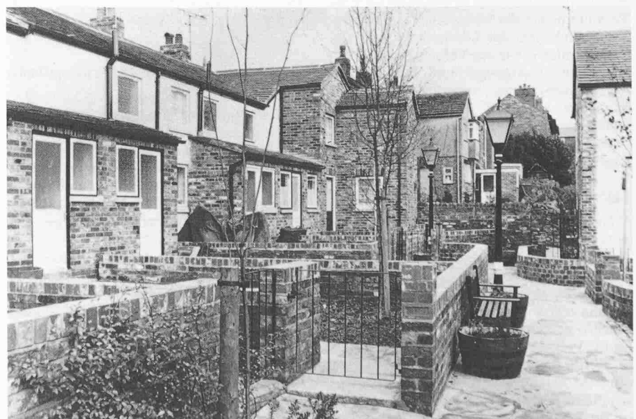
Mention: R. P. Hackney, architecte à Macclesfield, pour la rénovation d'un quartier de maisons unifamiliales à Macclesfield (Royaume-Uni), après rénovation