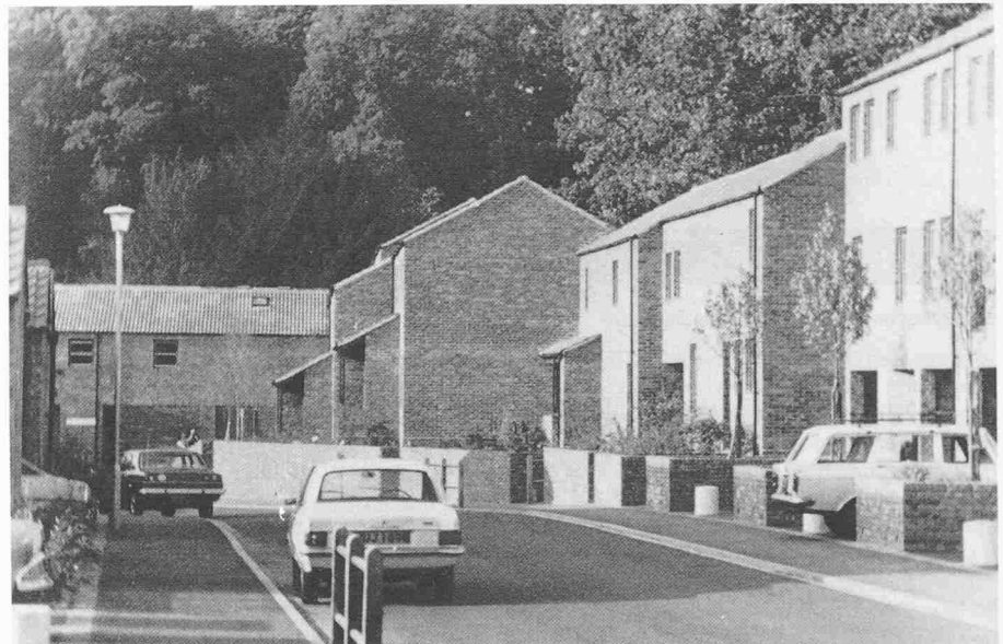
Deuxième prix: Phippen, Randall et Parkes, architectes à East Molesey, pour un ensemble de maisons unifamiliales et d'appartements à Bracknell (Royaume-Uni)