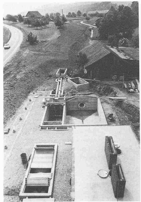
Die Kläranlage im Bau. Zu sehen sind auf der Decke des Faulraumes die beiden Lüftungskamine, die eine Gasansammlung unter dem Satteldach verhindern.

Neben der Zugänglichkeit des Faulraumes bildete speziell dessen Entlüftung ein Problem. Eine Gasansammlung unter dem Dach musste unter allen Umständen vermieden werden. Die Lösung brachten zwei Kamine , die über einen Firstschlitz entlüftet werden. Der zusätzliche Raum im « Estrich », der sich durch die Dachform ergibt, ist nicht etwa überflüssig, er dient dem Klärwart zum Aufbewahren seiner Arbeitsutensilien (Leitern, usw.).