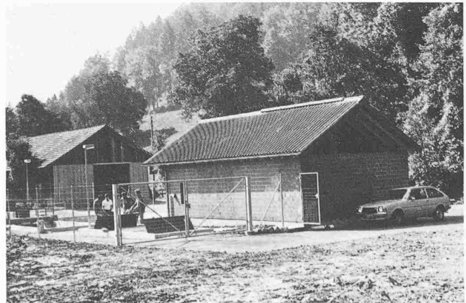
Blick auf ARA und alte Sägerei. Dachform und Proportionen stimmen überein. Der «Estrich» wird mit einer Rückwand noch abgeschlossen