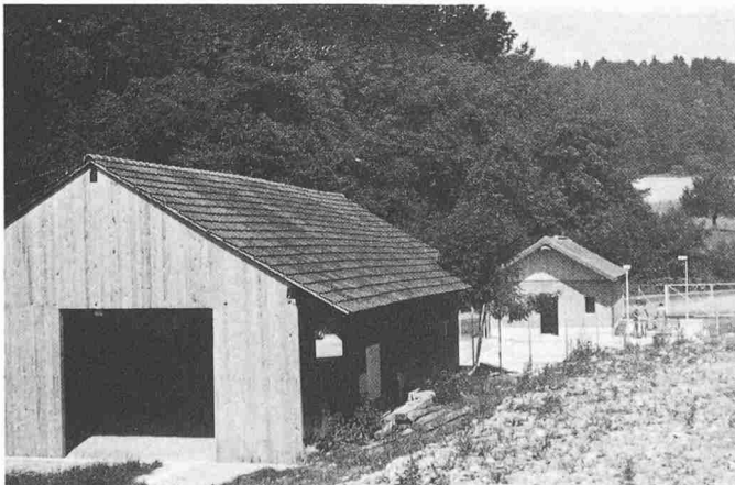
Die alte Sägerei im Vordergrund wurde mit der ARA als Gemeindemagazin instandgestellt.