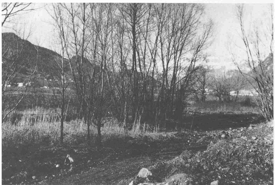
Neues Naturschutzgebiet im alten Wangser Kiesfang

Zu erwähnen ist noch, dass das Projekt 1944 auf der Annahme aufbaute, mit