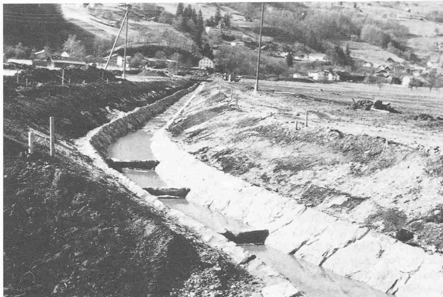
Neuanlage des Wangserbaches

Grundstein gelegt, um mit den ersten Arbeiten für die Melioration der Saarebene zu beginnen. Die Verlegung der Saarmündung bis unterhalb Trübbach, war 1961 abgeschlossen.