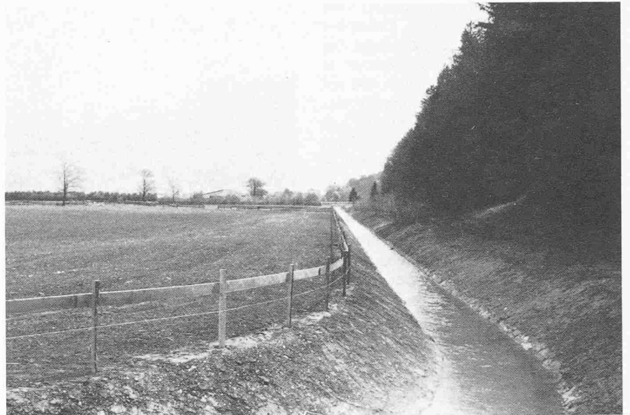
Neuer Saschielgraben als Grenzgewässer zwischen Wald und Kulturland

In der Folge sind immer wieder erneut Projekte für dieses Werk aufgestellt und Vorstösse einflussreicher Männer in St. Gallen unternommen worden, um endlich die Bewohner dieses Kantons teils von der Wassernot zu befreien und vor der steten Angst zu erlösen. Die Saarebene hat aufgrund ihrer verkehrstechnischen Lage schon in historischer Zeit ihre Bedeutung erhalten und ist bis auf den heutigen Tag eine Drehscheibe des Verkehrs geblieben. Schon die römischen Strassen durchquerten das Sarganserland von den bündnerischen Alpenübergängen her in Richtung Zürich und dem Bodensee. Aber erst mit dem Bau der Eisenbahnen wurde hier die Gewässerkorrektion aktuell. Am 29. Mai 1855 wurde zwischen dem Eisenbahnunternehmen und dem Vorstand der Saarkorrektionskommission ein Bauvertrag abgeschlossen, der die Gewässerkorrektion in die Wege leitete. So riefen schon damals die Verkehrsprobleme (der Bau der Eisenbahn) der Lösung des langbegehrten Ausbaues des Kanalsystems in der Saarebene. 1858 war schon ein beachtlicher Teil des Kanalnetzes erstellt. Leider trat aber der erwartete Erfolg nicht ein, und so kam es schon in den Jahren 1860/61 zur Korrektur und Ergänzung dieser