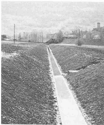
Neuer Vorflutgraben; zufolge geringen Gefälles war hier der Einbau einer Betonsohle nötig, während alle grösseren Kanäle bei entsprechendem Gefälle eine Kiessohle und eine Seitenpflasterung aus Natursteinen erhielten

dem zunehmenden motorisierten Verkehr werde die bestehende Staatsstrasse Sargans-Bad Ragaz ausgebaut. Vom Nationalstrassenbau sprach in jener Zeit noch niemand.