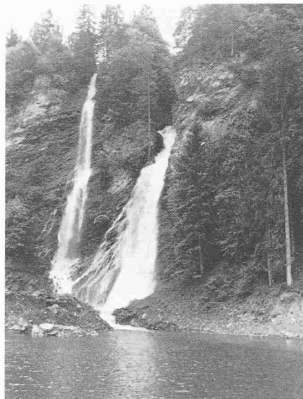
Rechts der Saarfall mit dem neuen grossen Kiesfang, links der Wasserfall der Kleinen Saar während deren Umleitung zufolge des Baues des neuen Ableitungskanals in den Kiesfang des Saarfalles

Bauwerke. Die Vorflut wurde nicht besser, die Abflussverhältnisse schlimmer. Verschiedentlich war der Wasserspiegel in den Kanälen wesentlich höher als 1832. Infolge Drängens seitens des Bahnbaues mussten die Entwässerungskanäle zu rasch erstellt werden, so dass sich bald schon die Nachteile zeigten. Es ergaben sich Unregelmässigkeiten durch Kiesanhäufungen, welche auf nachlässige und unrichtige Aushebungen zurückzuführen waren. Die Grundursache war aber der zu kleine Querschnitt und die zu geringere Tiefe der Kanäle. Die Giessen (alte Grundwasserläufe) lagen tiefer und führten das Wasser besser ab. So mussten bereits Ergänzungsarbeiten ausgeführt werden. Detailentwässerungen und Güterzusammenlegung blieben aber unausgeführt.