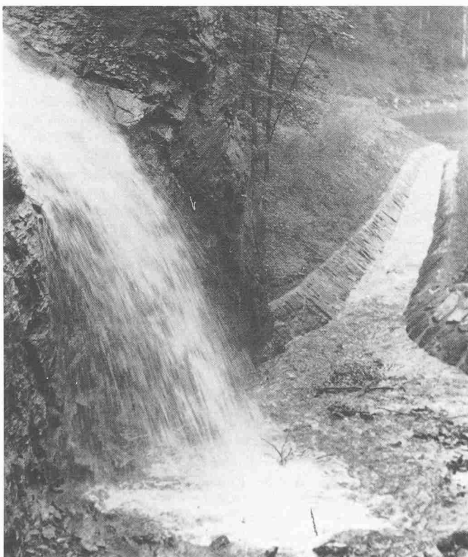
Der Wasserfall der Kleinen Saar und deren Ableitung in den Kiesfang des Saarfalles

Alle diese neuen Gesichtspunkte verkehrstechnischer Natur erforderten eine Umarbeitung des Projektes der Melioration der Saarebene von 1944. Dies betraf ganz wesentlich das geplante Flurwegnetz. Während man beim ursprünglichen Projekt 1944 noch den Ausbau der bestehenden alten Staats-