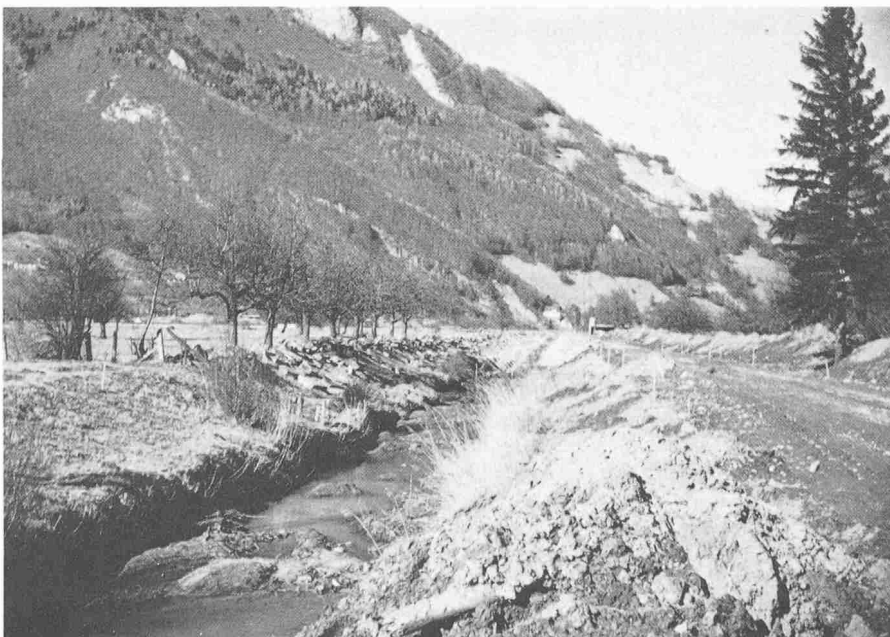
Bauarbeiten am Vilterser-Wangser Kanal, Blick talabwärts gegen den Weiler «Vild»

Nun brach der Zweite Weltkrieg aus, und bereits war die Melioration der Linthebene als eidgenössisches Werk in Ausführung begriffen. Auch wurde die grösste je in unserem Lande zur Ausführung gelangte Melioration der Rheinebene in Angriff genommen. Mit dem ausserordentlichen Kriegsmeliorationsprogramm sind auch im Kanton St. Gallen zahlreiche weitere grössere und kleinere Bodenverbesserungen verwirklicht worden. Endlich trat man dann 1941 auch an die Projektierung der Saarmelioration heran. Das Projekt teilte sich in einen wasserbaulichen und in einen kulturtechnischen Teil. Die Regierungsrätliche Botschaft über die Me-