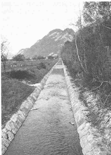
Der verbreiterte und vertiefte Saarableitungskanal, Kiessohle und Natursteinpflasterung unter Schonung des linksufrigen alten Baumbestandes