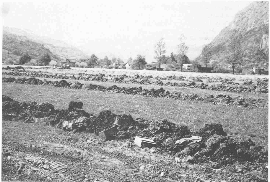
Entwässerungsgräben für die Detaildrainage

lioration der Saarebene ist datiert vom 13. November 1945. Ende Dezember des gleichen Jahres fanden dann die Abstimmungen der Grundbesitzer in den einzelnen Gemeinden statt, die mit grosser Mehrheit Zustimmung für das gesamte Projekt ergaben. Dieses sah vor, die neue Saarmündung 2,45 km rheinabwärts zu verlegen. An der neuen Mündungsstelle sollte die Sohle des Kanals über die heutige mittlere Rheinsohle zu liegen kommen. Bei einem Sohlengefälle des Kanals von 0,7% ergab sich für den Saarkanal bei Trübbach eine Sohlenlage, die um 1 m tiefer liegt als die damalige Saarsohle. Somit kann ein Hochwasser des Rheins die Saar nicht mehr zum Überfluten bringen. Die Mündungsverlegung bedingte die Unterführung der Saar unter dem Trübbach hindurch. Auf der insgesamt 2,7 km langen Kanalstrecke sollte die Kanalsohle auf 1,8 km Länge in das