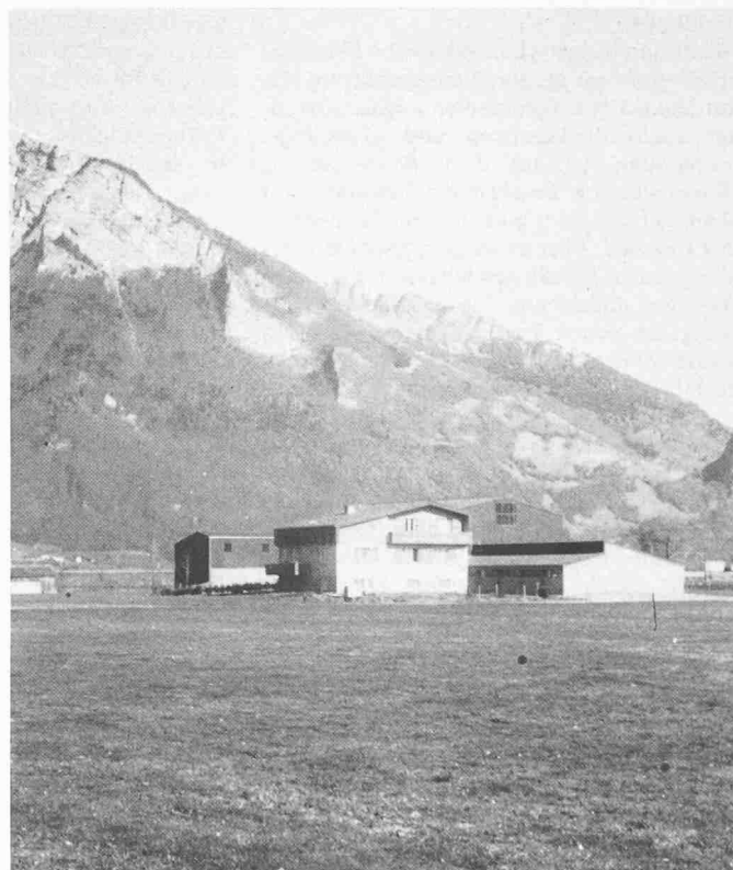
Hofsiedlung in der Melser «Baschär», Baujahr 1972/73