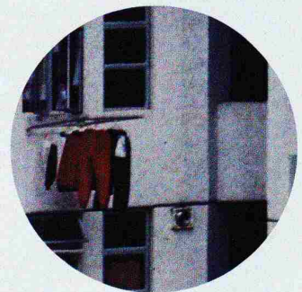
Bessie Nager LIGHTHOUSE, 2000