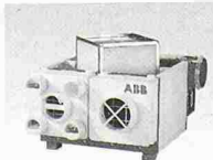
ABB Ventilatoren mit WRG 4 Anschlüsse 80 mm Ø; 400 m³/h, für Bad-/ WC- und Küchen-Ent- lüftung in STWE und EFH. Von ANSON!

ANSON DECOR Abzugshauben für designbetonte Küchen und Kochin- seln. Auch inox. 230 V 400–1000 m³/h. – Ange- bot verlangen von: