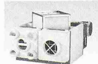
ABB Ventilatoren mit Wärmerückgewinnung 400 m 3 /h, motorlose, lärmfreie Abzugshauben = die perfekte Lösung! – Offerte von:

ANSON DECOR Abzugshauben für designbetonte Küchen und Kochinsel. 400–1000 m 3 /h. Auch inox+farbig.