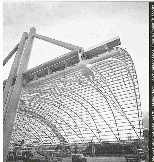
Projekt: Postautostation Chur Hallendach Architekten: Brossi Chur & Obriet St. Moritz

Stahl-Glas-Konstruktionen in architektonisch perfekter Vollendung verwirklichen wir mit innovativen Ideen und höchsten Anforderungen an Materialien und Ausführung.