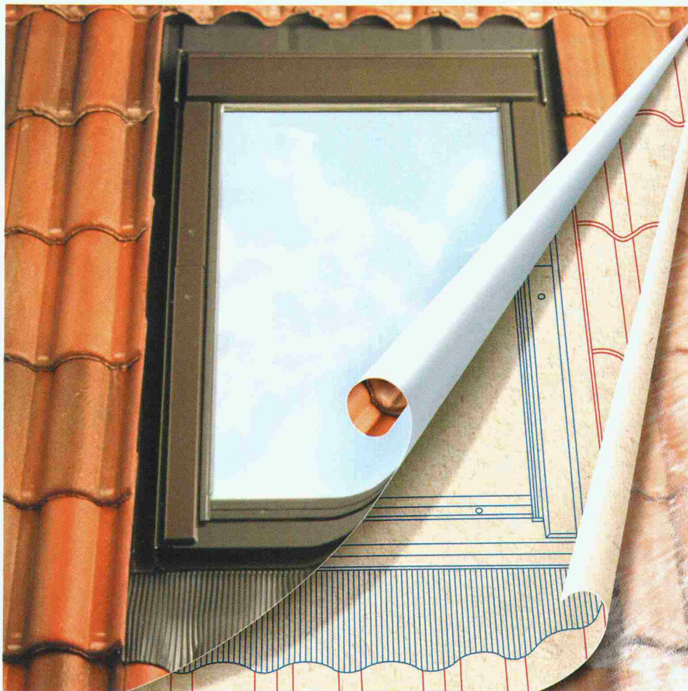
Einfacher und sicherer Einbau