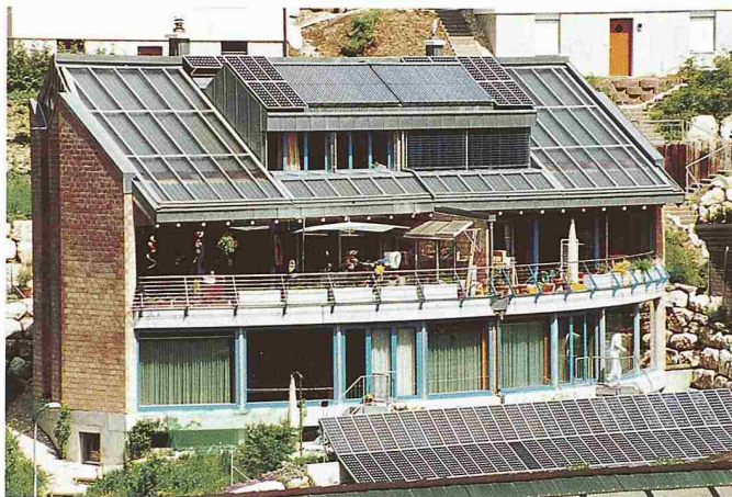
Vier-Familien-Solarhaus in Oberdorf BL, Solartechnik Holinger Solar AG

IDC AG Luzern 6005 Luzern Tel. 041 368 20 70