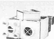
ABB Ventila- ren mit WRG

Mit Zeitautomatik. Formschön. 230 V 80 m³/h 300 Pa. Auch in AP-Ausführung. CE- konform. Von ANSON