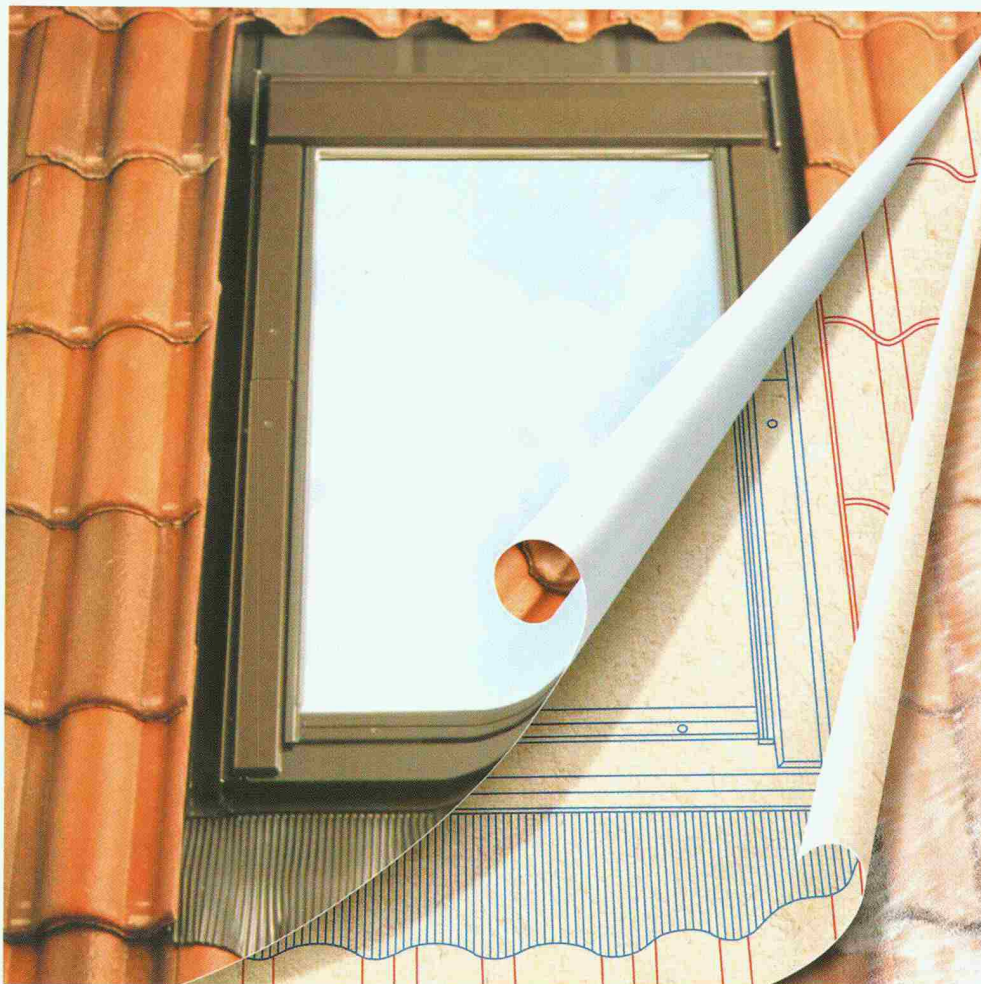
Einfacher und sicherer Einbau