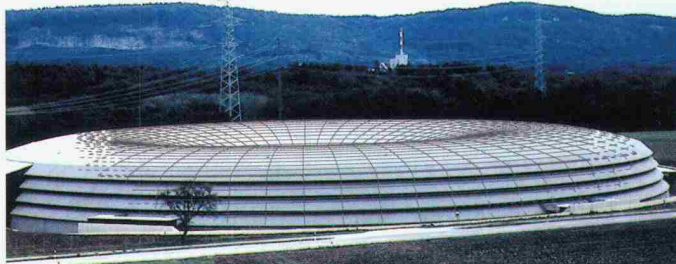
Synchrotron Lichtquelle Schweiz. Architektur: GWJ Architekten AG Bern, Team Marchand + Partner