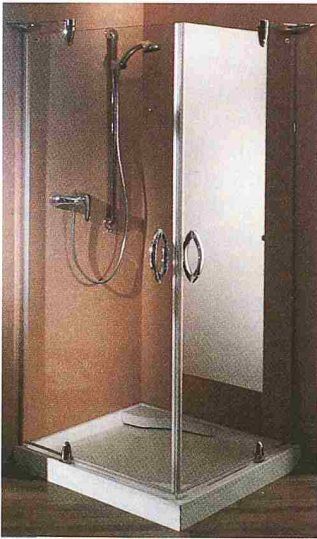
Dusche Studio 3001 Plus mit Drehtüren aus Glas von Hüppe