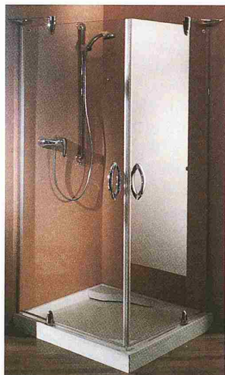
Dusche Studio 3001 Plus mit Drehtüren aus Glas von Hüppe