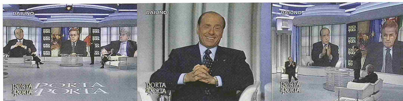
Porta a Porta, RAI1, montags bis freitags 22.55 Uhr

Inszenierte Auftritte betonen die Rolle von Gästen und Moderierenden. Die ersten werden als Star gefeiert, die zweiten können in der Darbietung das Divine erreichen