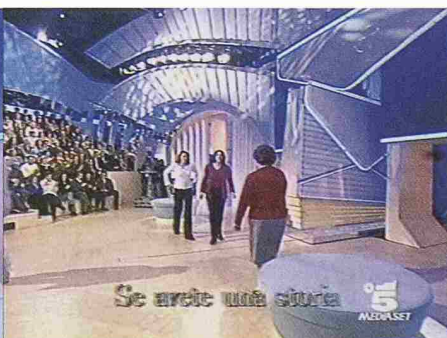
C'è posta per te, Canale5, freitags 21.00 Uhr

... Hinterzimmer oder Zwischenwände widerspiegeln kommunikative Zusammenhänge oder diskursive Brüche zwischen den Beteiligten