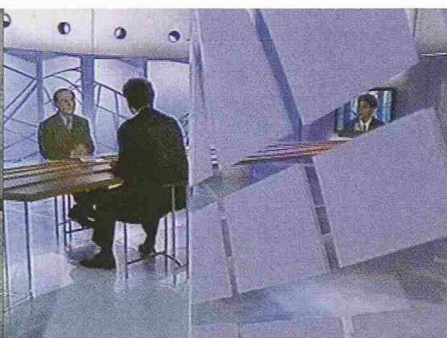
Envoyé special, France2, donnerstags 20.50 Uhr