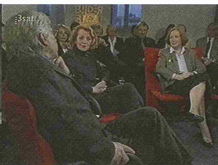
Bilderstreit, 3sat, donnerstags 22.25 Uhr (nächste Sendung am 13.4.00)