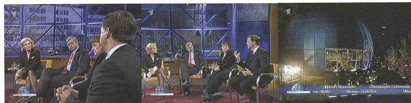
Sabine Christiansen, ARD, sonntags 21.45 Uhr