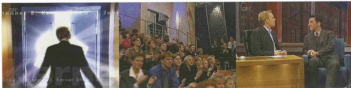
Die Johannes-B. Kerner Show, ZDF, donnerstags 23.00 Uhr

Inszenierte Auftritte betonen die Rolle von Gästen und Moderierenden. Die ersten werden als Star gefeiert, die zweiten können in der Darbietung das Divine erreichen