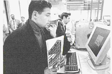
Per Mausclick abrufbar: Das neue SIA-Porträt mit über 100 Referenzobjekten von SIA-Mitgliedern und der Normensammlung

Als «Drehzscheibe für Planen und Bauen von Lebensraum mit Lebensqualität im 21. Jahrhundert» war der SIA-Stand im ersten Stock der Rundhofhalle ein gut besuchter Treffpunkt für private und öffentliche Bauherren, Mitglieder und potentielle Mitglieder – allen voran HTL- und Fachhochschulabsolventen, die sich für die assoziierte Mitgliedschaft interessierten –, aber auch Behördenvertreter und Partner aus der Bauwirtschaft trafen sich am SIA-