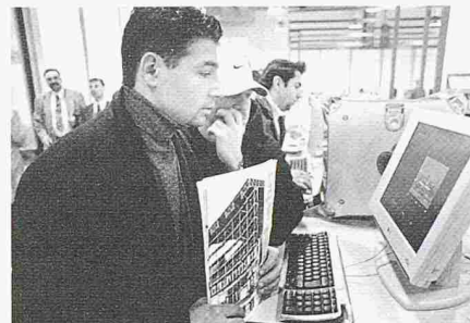
Per Mausklick abrufbar: Das neue SIA-Porträt mit über 100 Referenzobjekten von SIA-Mitgliedern und der Normensammlung

Als «Drehscheibe für Planen und Bauen von Lebensraum mit Lebensqualität im 21. Jahrhundert» war der SIA-Stand im ersten Stock der Rundhofhalle ein gut besuchter Treffpunkt für private und öffentliche Bauherren, Mitglieder und potentielle Mitglieder – allen voran HTL- und Fachhochschulabsolventen, die sich für die assoziierte Mitgliedschaft interessierten –, aber auch Behördenvertreter und Partner aus der Bauwirtschaft trafen sich am SIA-