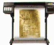
HP DesignJet 1055CM