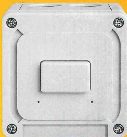
Schalter NAP 84 x 84 mm, Höhe 68 - 86 mm

Die Systemelemente lassen sich mittels Zwischen-nippel beliebig kombinieren , können mit seitlichen Bohrungen versehen werden und tragen immer ein Bezeichnungsschild. Qualität bis ins Detail.