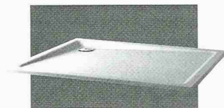
Duschtasse «Jubilar 2000» im praktischen Rechteckformat

Diese komfortablen Duscheneinrichtungen sind durch die porenfreie, kalk- und schmutzabweisende Oberfläche überaus reinigungsfreundlich. Die Oberfläche bleibt auch im nassen Zustand grif-