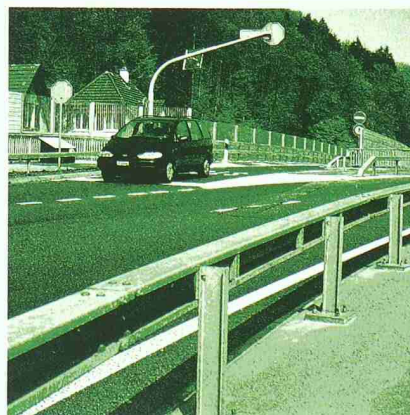
Diverse Strassen- und Brücken- ausrüstungen Equipements divers pour routes et ponts