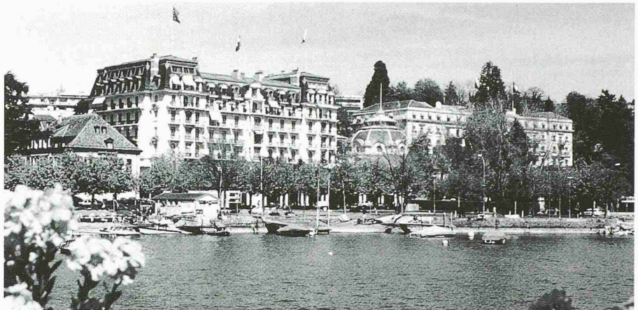
Das «Beau-Rivage Palace» in Lausanne-Ouchy wurde wegen vorbildlicher Umbauten zum historischen Hotel des Jahres 1999 erkoren. Das erste Gebäude von 1861 wurde nach Plänen des Genfer Architekten François Gindroz durch die in Lausanne ansässigen Architekten Achille de la Harpe und Jean-Baptiste Bertolini erbaut