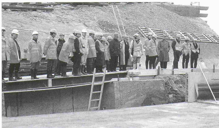
Baustelle der Bahn 2000 Zürich–Thalwil