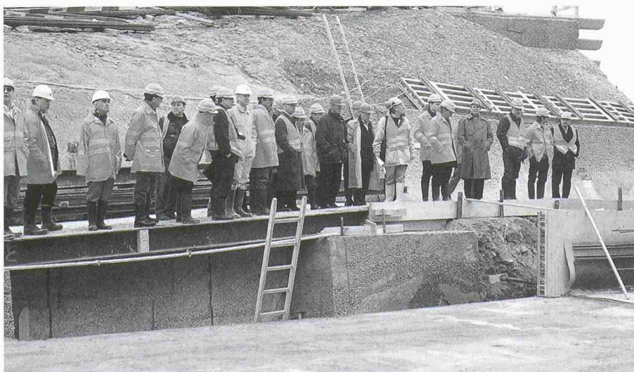
Baustelle der Bahn 2000 Zürich-Thalwil