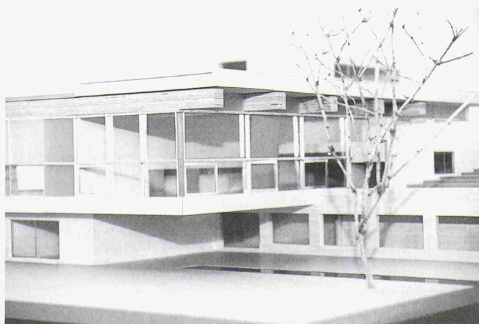
Neubau des Swiss-Re-Seminarzentrums im Modell

mer, die durch einen Restaurantanbau erweitert wird, und einem länglichen, zur bestehenden Anlage diagonal gesetzten Neubau. Für das insgesamt 69 575 m 3 Raum-inhalt (SIA 116) umfassende Vorhaben haben die Architekten beschlossen, mit Architektenkollegen und Künstlern zusammenzuarbeiten: So wurde für die Gartengestaltung das Büro Kienast & Vogt beigezogen, für die Innenraumgestaltung der Villa Bodmer ist Günther Förg mitverantwortlich, Adolf Krischanitz für Teile des Neubaus, Hermann Czech für den Innenausbau von Restaurant und der kleinen Bar, allgemein unterstützt durch den Textilkünstler Gilbert Bretterbauer. Auf die Eröffnung dieses Gesamtkunstwerks, für welches eine ganze Gruppe verantwortlich zeichnet, darf man sich wohl freuen!